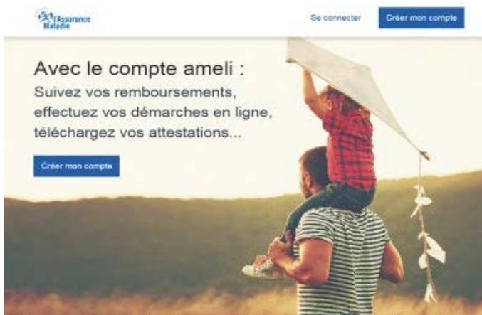
Le compte ameli

> Découvrez le service d'accompagnement sophia asthme